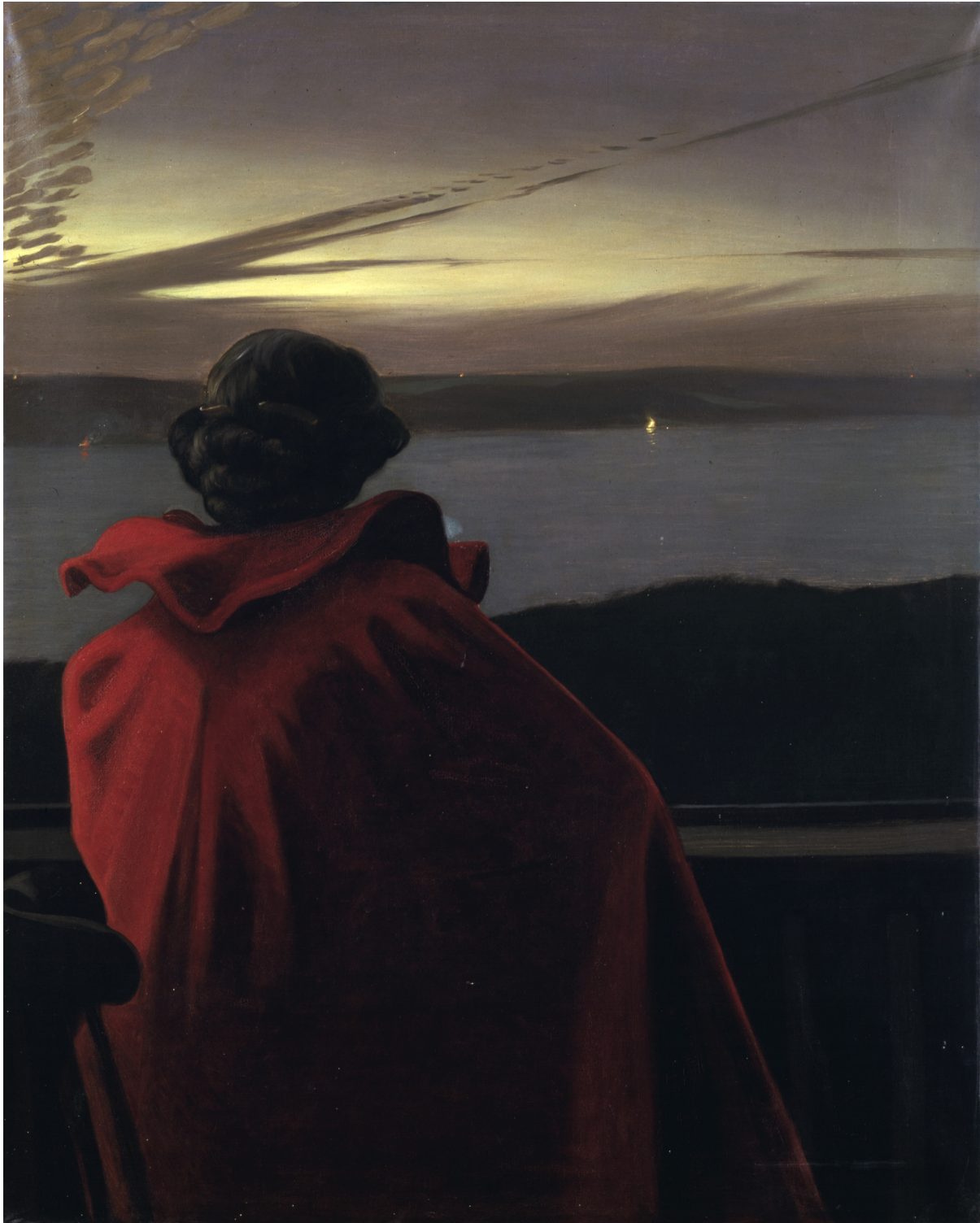
Harald Slott-Møller, Sankt Hans aften ved Vejle Fjord, olie på lærred, 1904

Bagefter kan du prøve at finde originalen her på museet.