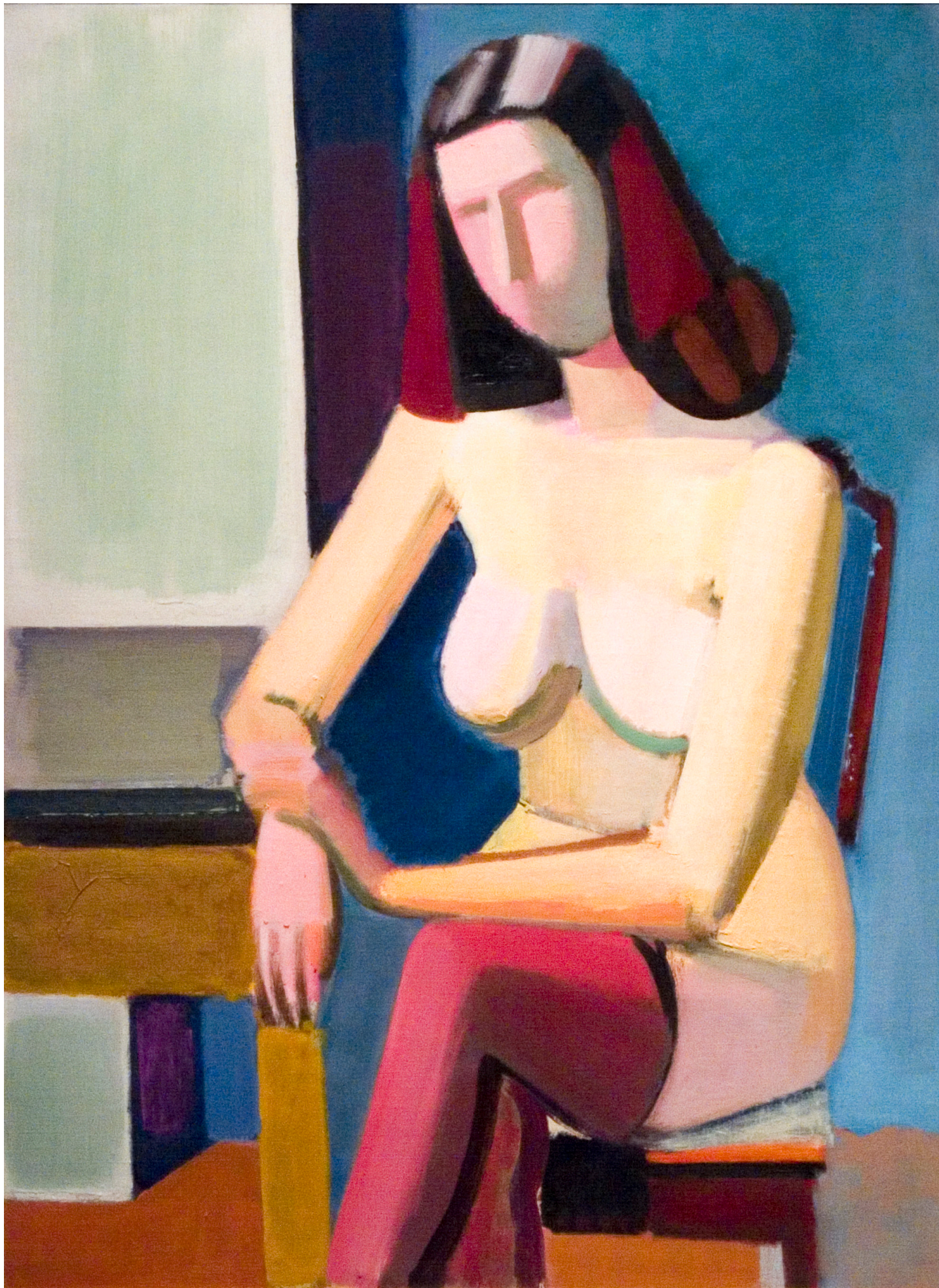
Vilhelm Lundstrøm Model med strømper Oliemaleri, 1941